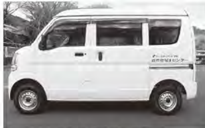
配食サービス車輛