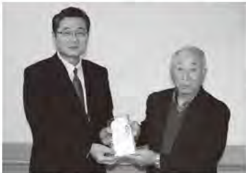
庄内町グラウンドゴルフ協会