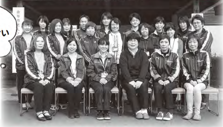
由布市地域包括支援センター