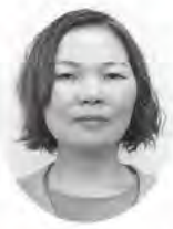
湯地 さつき 包括支援センター