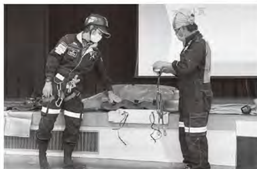
ブルーシート張り演習