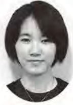
松尾 眞知 包括支援センター