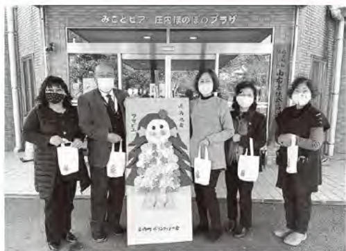
庄内町ボランティアの会