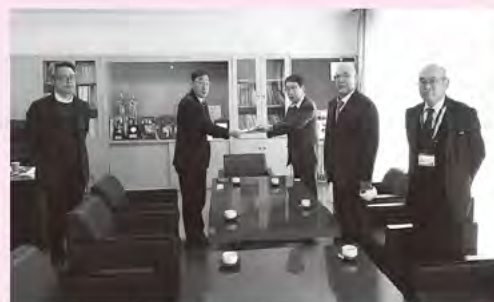
※写真撮影時のみマスクを外しています。

由布高校郷土芸能部へ活動を支援するため、寄付をさせていただきました。今年度由布高校郷土芸能部は新型コロナウイルスの影響で活動が大きく制限されたそうです。