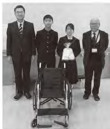
庄内中学校 車いす寄贈