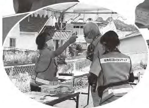
活動前の体温測定

由布市災害ボランティアセンター 開設期間：令和2年7月13日～8月3日 (詳細は2ページをご覧ください。)