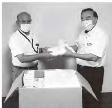
日本福祉理美容安全協会さま