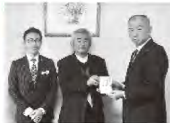
湯布院町更生保護女性会 チャリティバザーでの 売上の一部を ご寄付いただきました