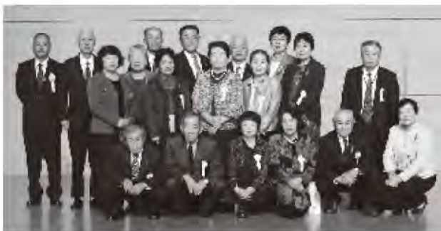
表彰者のみなさま(由布市)