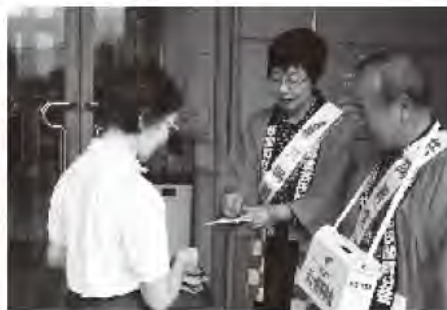
赤い羽根街頭募金 (イオン挟間店)