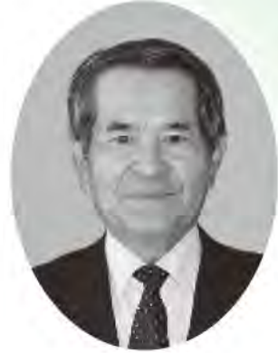
社会福祉法人 由布市社会福祉協議会