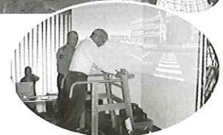
9月10日(水) 柿原老人クラブ 交通安全教室(擬似体験)