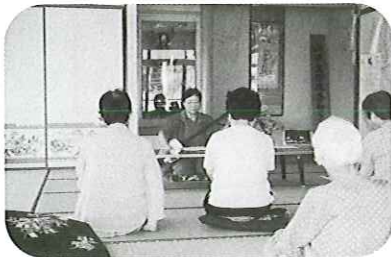
8月26日(火) 山田地区 三味線に合わせて楽しく歌いました