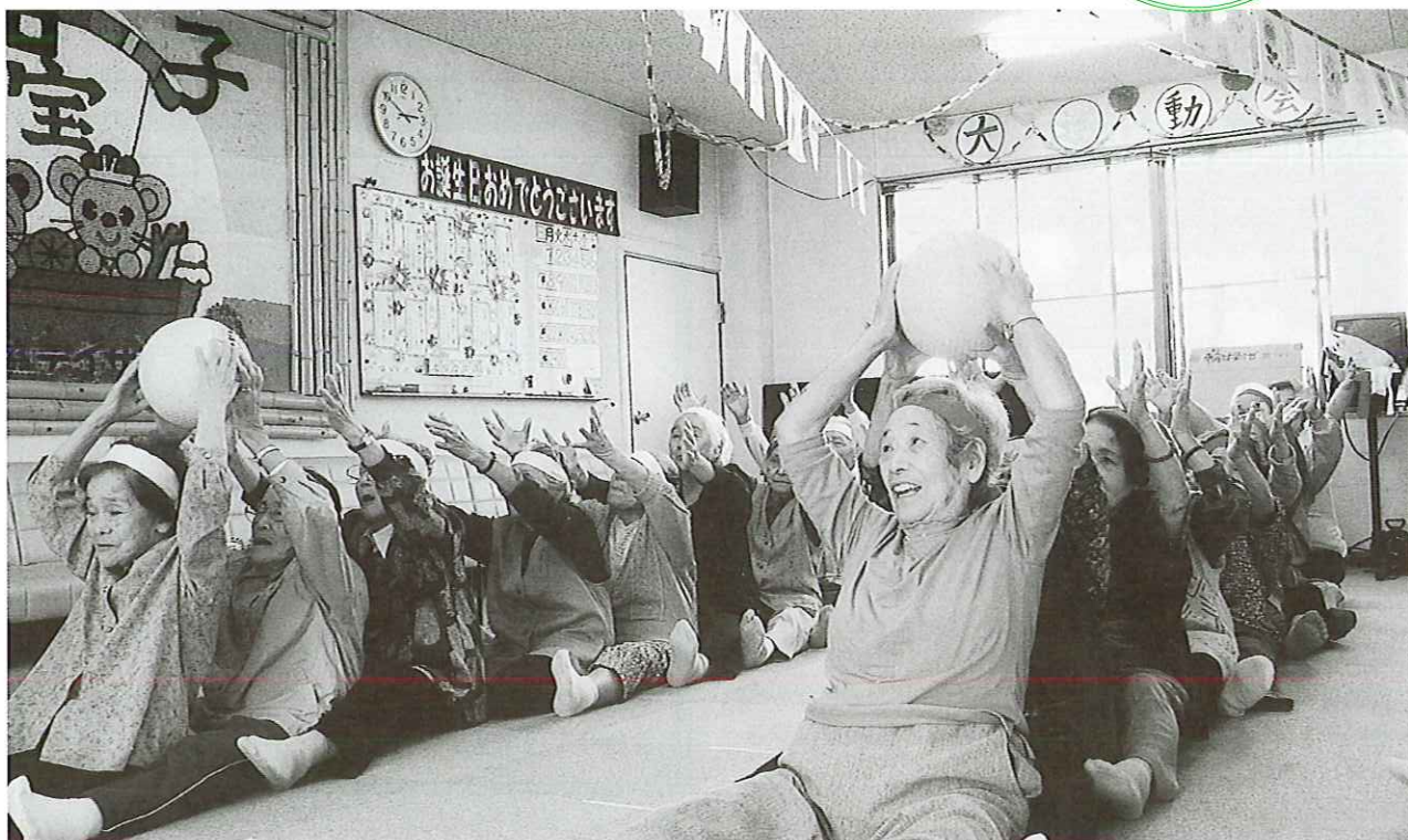
湯布院事務所デイサービス利用者の運動会の様子です。 「赤勝て！白勝て！」など白熱した応援合戦、飴喰い競争、玉入れなどの競技で大いに盛り上がりました。