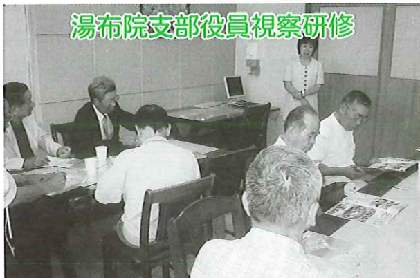
湯布院支部役員視察研修

9月2日(火)～3(水)にかけて身障協湯布院支部役員視察研修が行われ、熊本県産山村にある通所授産施設「インターワーク」を訪問しました。施設長より施設の理念等を説明していただき、施設内を見学させていただきました。とても真剣に作業に取り組む姿が印象的でした。