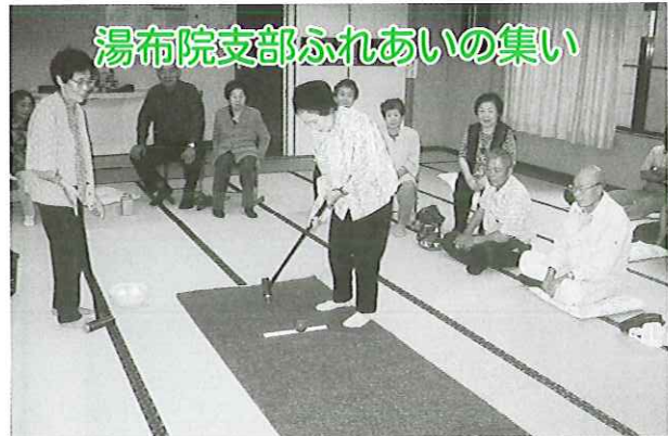
湯布院支部ふれあいの集い

9月2日(火)～3(水)にかけて身障協湯布院支部役員視察研修が行われ、熊本県産山村にある通所授産施設「インターワーク」を訪問しました。施設長より施設の理念等を説明していただき、施設内を見学させていただきました。とても真剣に作業に取り組む姿が印象的でした。