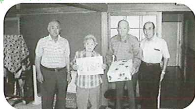
今次ご夫妻（庄内町）

「敬老の日」の大分県老人クラブ連合会事業として、夫婦ともに88歳で、結婚50年以上を迎えられたご夫婦に、記念品と寿詞の贈呈を行っています。由布市では3組のご夫婦にお祝い品が届けられました。