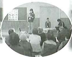
3/15 庄内原深谷第1・2老人クラブ