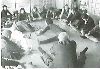
甲斐田老人クラブ