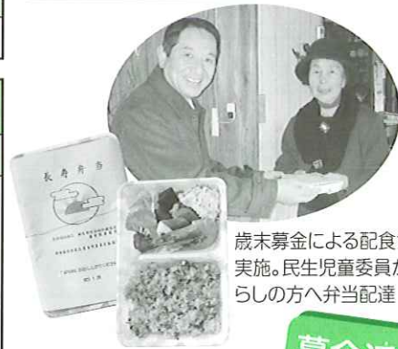
歳末募金による配食サービス実施。民生児童委員が一人暮らしの方へ弁当配達