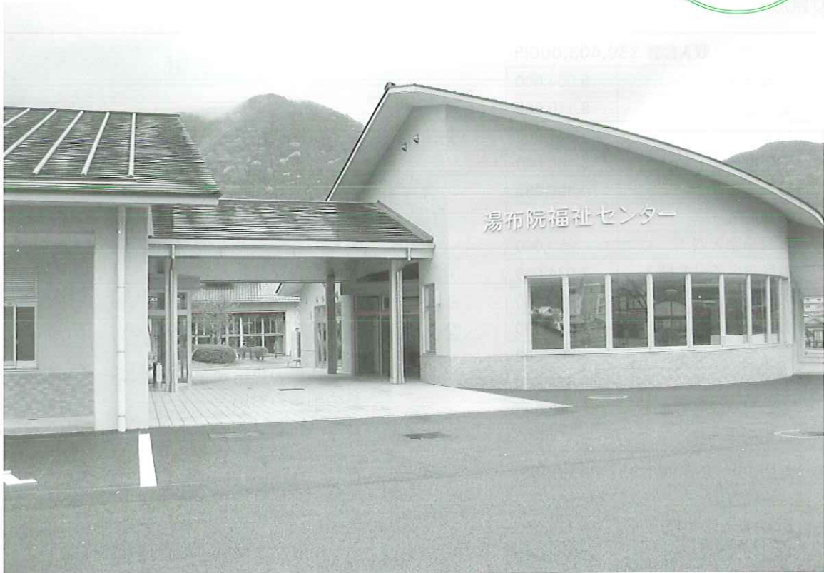
新湯布院福祉センター