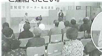
2/19 認知症サポーター養成講座

地域包括支援センターについての説明、認知症についての講話を行いました。地域包括支援センターでは地域に出向き啓発活動を行っていますので関心のある方はお気軽にご連絡ください。