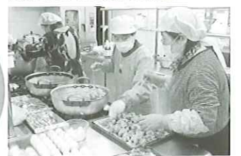
ボランティアの会、食推協、女性民協OBの会による弁当作り