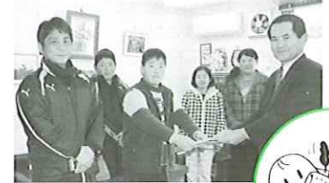
石城小学校児童会より募金