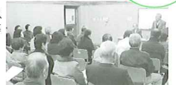
弁当作りの3団体の方と民生児童委員協議会による出発式の開催