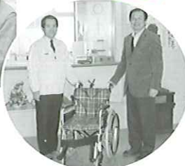
介護事業所へ車椅子の寄付