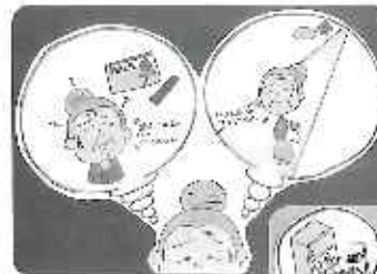
紙芝居で認知症をわかりやすく説明します。