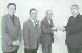
由布市グラウンドゴルフ協会庄内支部