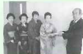
庄内町文化芸術振興会