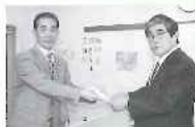
みらい信金同友会向原支部