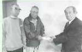
由布市ゲートボール協会庄内支部