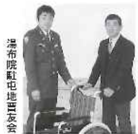
湯布院駐屯地言友会