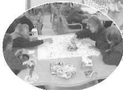
湯布院事務所デイサービス 辰の作品