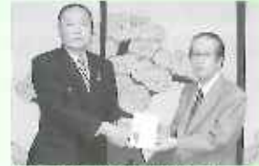
湯布院町文化芸術振興会