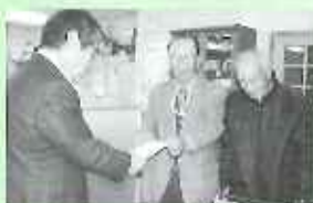
シルバー人材センター

昨年12月1日から実施しました歳末たすけあい募金には多くの皆様からご協力いただき、誠にありがとうございました。皆様からお寄せいただいた募金は、配分委員会で配分が決定され地域福祉の向上に活用していきます。なお、内訳につきましては、次回号「社協だより」にてご報告申し上げます。