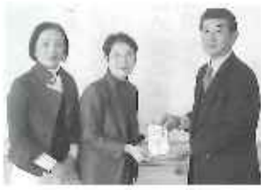
湯布院町更正保護女性会