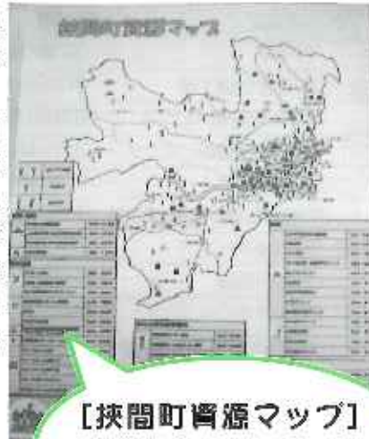
【挾間町資源マップ】 挾間町の介護サービスや病院、施設等を掲載しています。

挾間町では、住み慣れた場所で誰もが安心して生活できるような地域作りを目指して、平成20年度より地域ネットワーク会議を開催しています。会議のテーマは、「認知症」です。85歳以上の高齢者の4人に1人は認知症であると言われていた現在、認知症は他人事では済まされなくなっています。認知症になっても、住み慣れた地域で安心して生活していくためには、地域の中での支え合いが必要です。挾間町では、「資源マップ」や「あんしん登録カード」を作成しています。登録を希望される方、関心のある方は、地域包括支援センター挾間事務所までご連絡ください。