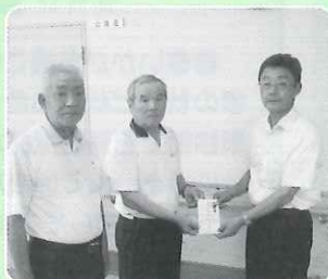
湯布霧会よりご寄付