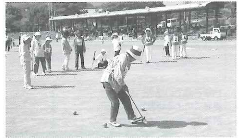
庄内支部スポーツ大会