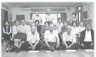
庄内 7月4日五ヶ瀬老人クラブ