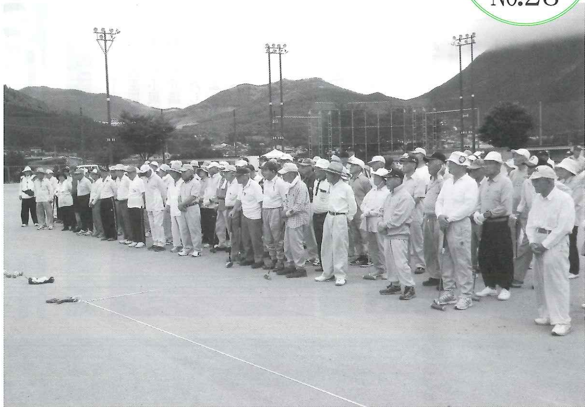
由布市老連湯布院支部スポーツ大会 開会式