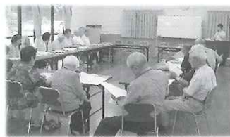
挾間 7月6日同朋老人会