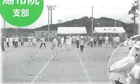
湯布院支部スポーツ大会