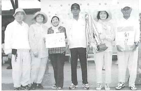
挟間支部ゲートボール大会