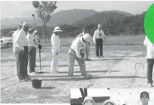
挟間支部 グラウンドゴルフ大会