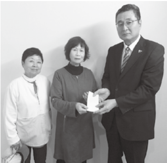
由布市ボランティア連絡協議会