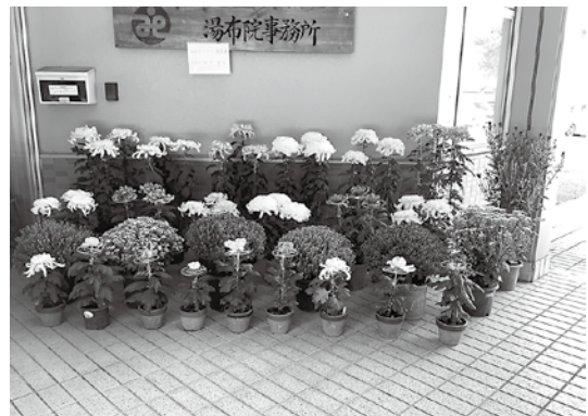
寄贈された菊の花