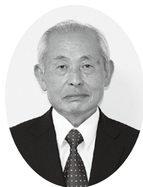
社会福祉法人 由布市社会福祉協議会