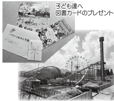
当日は天候にも恵まれました

今回、都合により参加できなかったご家族の皆さまにつきましては、次回の参加をお待ちしております。 また、開催にあたり、ご協力いただきました各関係機関の方々に深くお礼申し上げます。