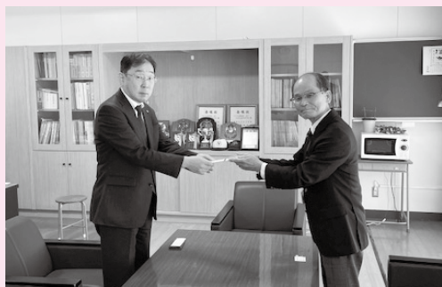
由布高等学校(校長先生)

令和4年3月3日、由布市社会福祉法人施設経営者協議会は、毎年実施しています由布高校郷土芸能部へ支援金の寄付と挾間中学校、庄内中学校、湯布院中学校を卒業する280名の生徒に「ゆふ湯歩WAONカード」に心ばかりの金額をチャージして贈呈しました。この「ゆふ湯歩WAONカード」は使用した売り上げ金額の0.5%が由布市へ寄付される仕組みになっています。市外に出てもどこかで由布市に貢献している、つながっていると卒業生に感じていただければ幸いです。