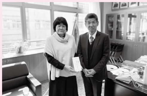
湯布院中学校(3年生主任、校長先生)