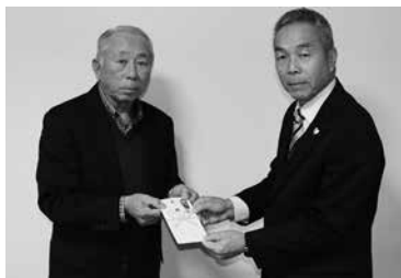
由布市庄内グラウンド・ゴルフ協会様