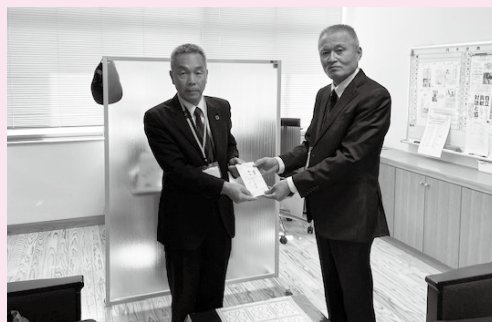
挾間中学校(校長先生)