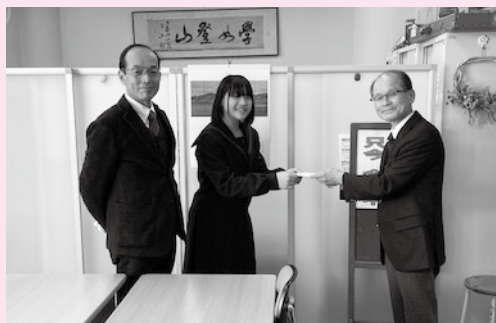
庄内中学校(校長先生、生徒代表)