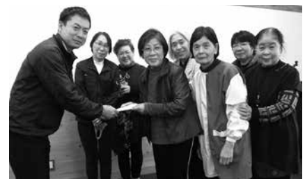
湯布院町更生保護女性会様