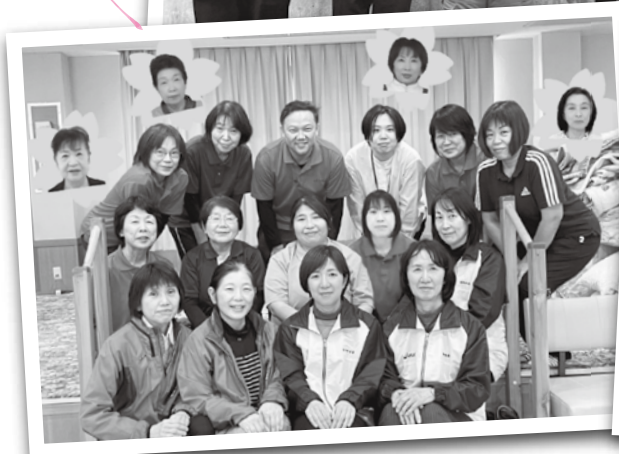
介護保険サービス事業課